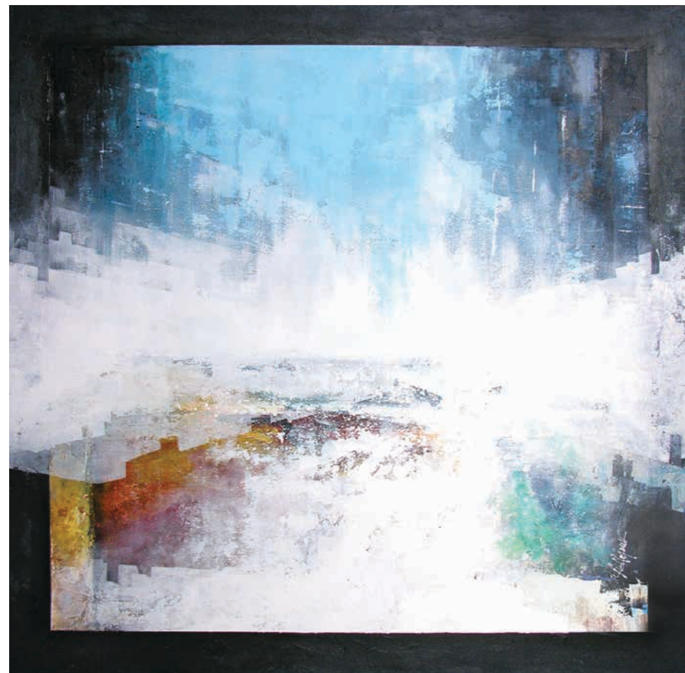
Avenue, acrylic on wood board, 40 x 40 in

Represented by: Galerie Courtemanche (Magog) Galerie 806 (Tremblant) Galerie Arts Versus (Sherbrooke)