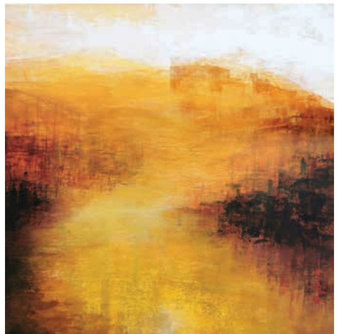
Vallée d'or , acrylic on wood board, 20 x 20 in