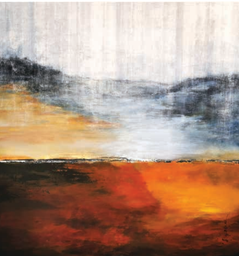
Red River , acrylic on wood board, 48 x 48 in